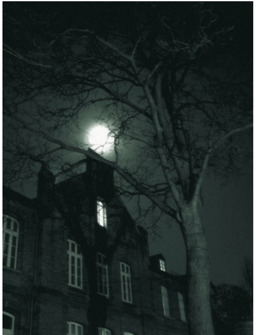
Die göttliche, universelle Energie kommt auch dann zur Wirkung, wenn es darum geht, eine Wohnung oder ein Haus zu entstören.

In früheren Zeiten war vielen Menschen der Gedanke durchaus vertraut, dass «böse» Menschen oder schwere, schicksalshafte Ereignisse Wohn- und Lebensräume mit negativen Energien gleichsam imprägnieren können. Räucher- und Segensrituale sollten den Un-Geist vertreiben und die Räume reinigen. Wir Leute von heute verlangen nach Beweisen und fugenloser Überprüfbar-